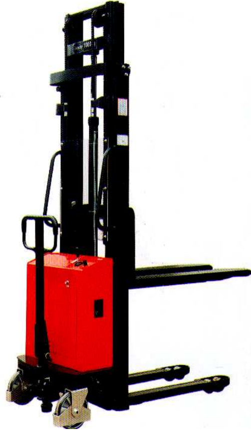
HES-160S avec longerons encadrant et fourches réglable (sur commande)